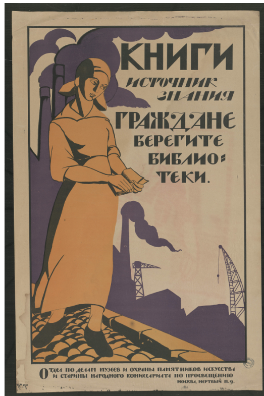
Affiche de propagande pour les bibliothèques (coll. La contemporaine, Nanterre).

Lutter contre la double exploitation économique et domestique doit permettre aux femmes d'être pleinement force de travail pour un État prolétarien productiviste, mais aussi de se consacrer à la science, à la créativité artistique, aux responsabilités administratives ou politiques. Des femmes sont promues dans les soviets, au parti, dans les instances des syndicats et des coopératives. Autant que possible, l'éducation des enfants et les tâches familiales seront collectives.