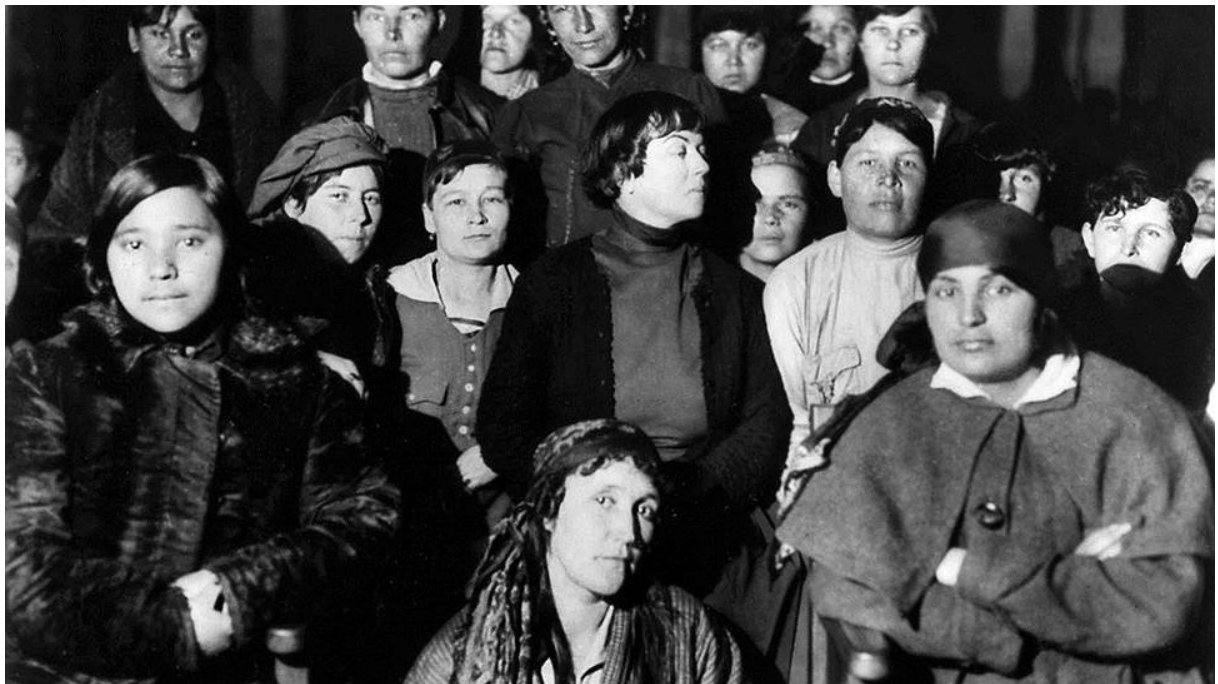
Au congrès des femmes d'Orient, Moscou, 1921.

« Hélas ! Cette vérité n'est aujourd'hui que trop évidente », conclut l'auteur de l'article en 1939, alors que la Seconde Guerre mondiale vient d'éclater. 6