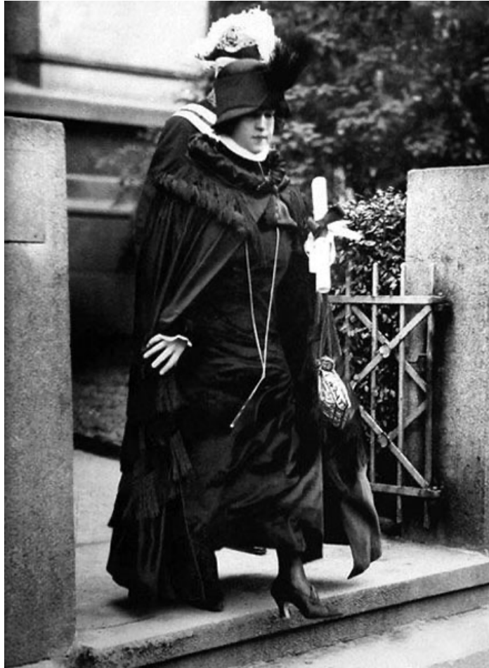
Présentation au roi de Norvège, 1923.