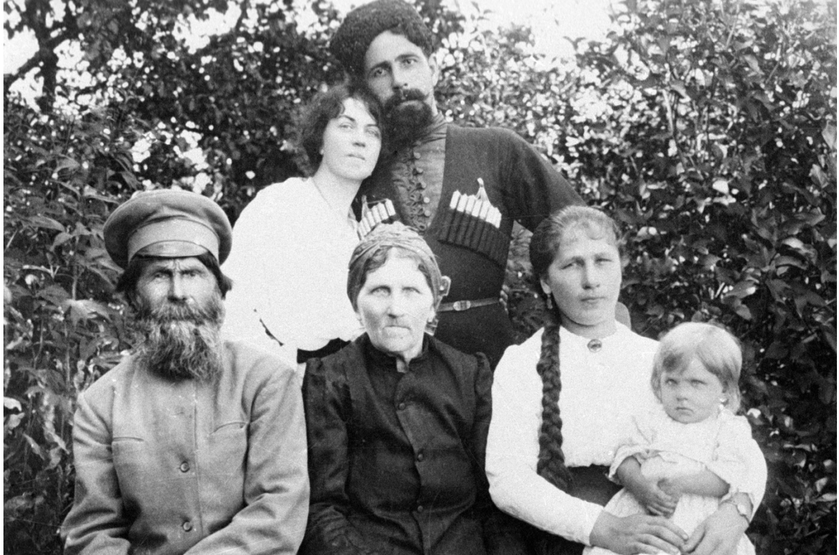
Avec Pavel Dybenko et sa famille en Ukraine, 1918.

Lorsqu'en 2017, le ministre des Affaires étrangères russe Sergueï Lavrov dévoile une plaque à l'occasion du 145 e anniversaire de sa naissance devant l'immeuble moscovite où elle avait habité, il fait l'éloge de la « patriote soviétique ».