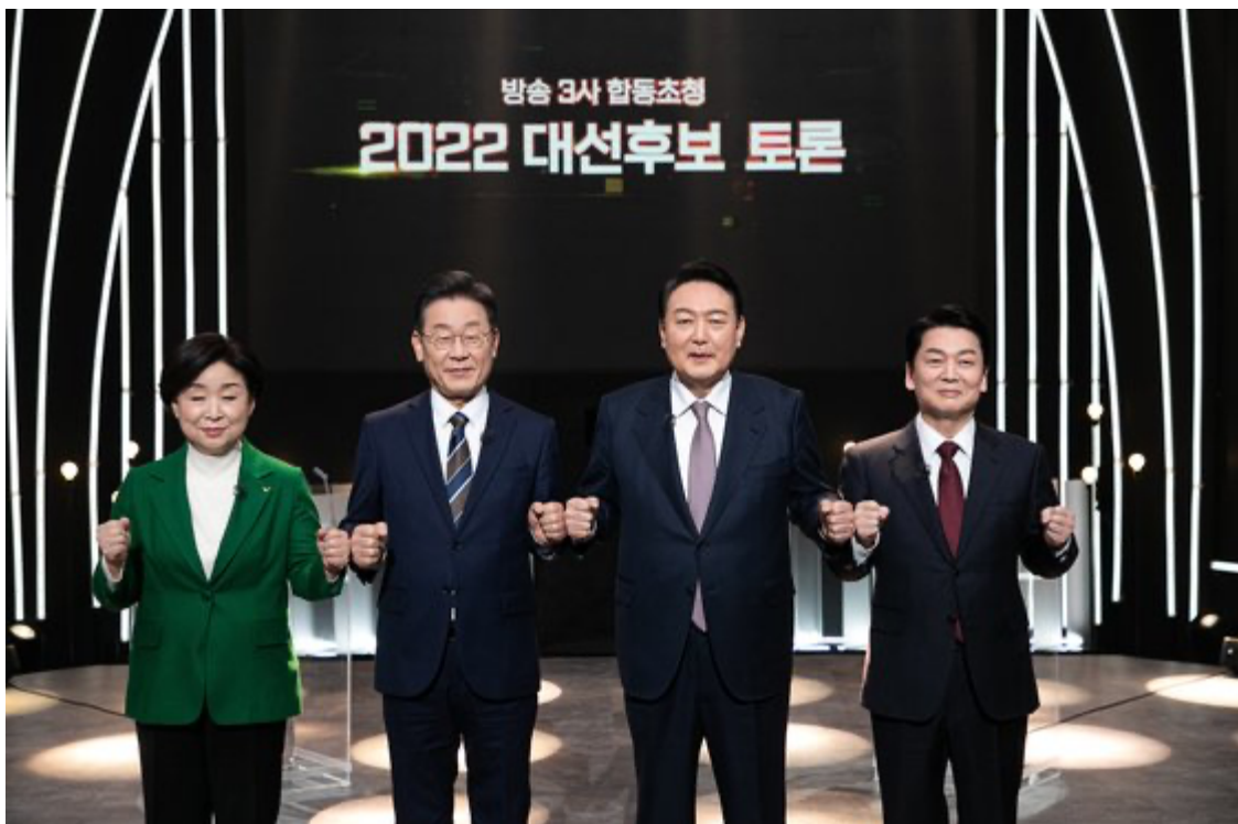
De gauche à droite : Sim Sang-jung (Parti de la justice, gauche radicale), Lee Jae-myung (Parti démocrate, centre-gauche), Yoon Suk-yeol (Énergie du peuple, droite populiste), Ahn Cheol-soo (Parti du peuple, centre entrepreneurial).

La nouveauté concerne plutôt les premiers que les secondes, puisqu'elles votaient déjà à 56 % pour le centre-gauche et à 18 % la gauche radicale lors de l'élection précédente – réputée perdue pour la droite, la pression du vote utile y était moindre. Le changement a été plus profond chez les jeunes hommes, dont les suffrages se partageaient il y a cinq ans presque à égalité entre les deux gauches d'un côté, de l'autre deux candidats de droite auxquels s'ajoutait un centre libéral, « entrepreneurial » à la Macron, alors représenté par un magnat des logiciels qui s'est retiré cette fois-ci in extremis au profit de la droite.