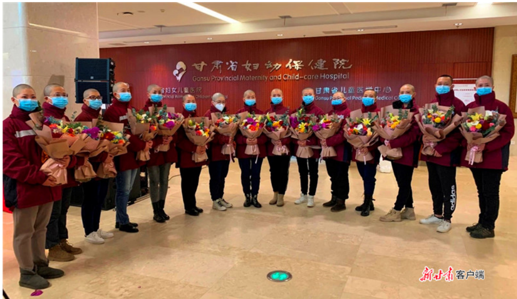
L'équipe de personnels soignants du Gansu avant son départ pour Wuhan

En revanche, la presse n'informe pas sur leurs compétences ou sur les conditions de la collaboration avec les équipes de Wuhan. En guise de remerciements, lors de leur départ à compter du 17 mars, des célébrations sont organisées dans l'espace public – défilés, encadrement par les forces locales de police ou remise de souvenirs mémoriels –, grande tradition des pays à gouvernement autoritaire.